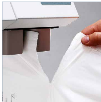
Beutel befüllen und an Perforation abreißen