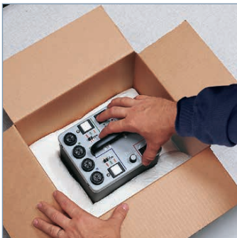
Transportgut einlegen - Beutel passt sich im Karton an