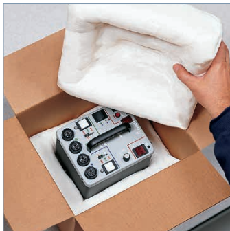
Weiteren befüllten Beutel auflegen und Karton verschließen

Klicken oder scannen Sie den QR-Code für Infos zum Produkt und Ansprechpartner in Ihrer Nähe.