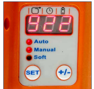
Anzeige der Einstellungen (Spannkraft, Verschweißzeit, Akku-Ladestand)