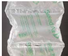
Fill Air Extreme Art.-Nr.: 103618