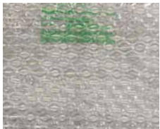
Bubble Wrap I.B. small, Art.-Nr.: 103616