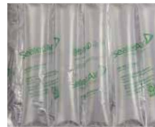
Fill Air Extreme AirWrap Art.-Nr.: 103619, 103620, 103621